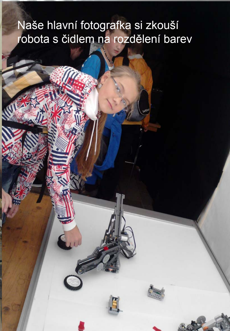
Naše hlavní fotografka si zkouší robota s čidlem na rozdělení barev